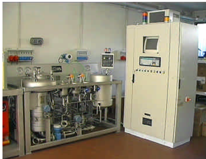
AUTOLABO con RBNV 270/510 completamente automatizzato.